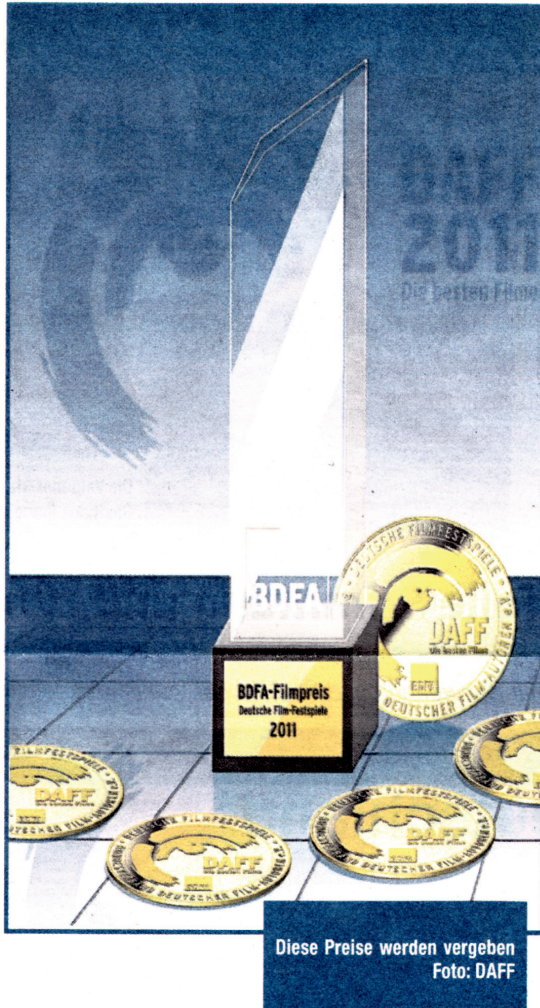
Diese Preise werden vergeben

Vom interessant gestalteten Dokumentar- oder Reportage- und Unterrichtsfilme über spannende Reisefilme, oft aus den abgelegensten Gebieten unserer Erde, über den Phantasie- und Trickfilm, den Videoclip, Unterwasserfilm und künstlerischen Spielfilm – hier werden dem interessierten Publikum die besten deutschen Produktionen des laufenden Filmjahres geboten. Alle Filmvorführungen werden von fünf kompetenten Juroren besprochen und bewertet. Die besten sieben Filme werden mit dem gläsernen Obelisk ausgezeichnet. Die Jury entscheidet auch über die Weitermeldung zu den Weltfilmfestspielen (UNICA),